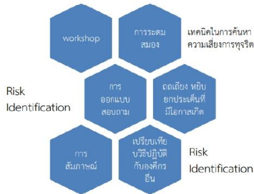
ตารางที่ ๑ ระบุความเสี่ยง( Known factor และ Unknown factor) รายละเอียดความเสี่ยงการทุจริต เช่นรูปแบบ พฤติการณ์การทุจริตที่มีความเสี่ยงต่อการทุจริต